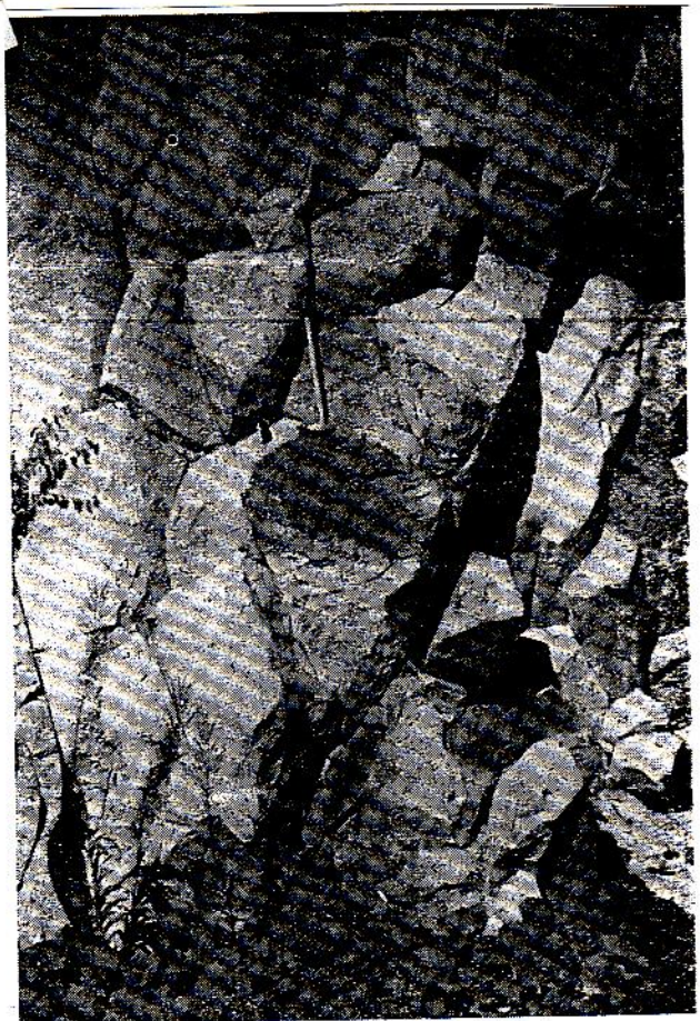
Obr. 36. Nepravidelně polyedrická odlučnost čediče Podmoklice u Semil